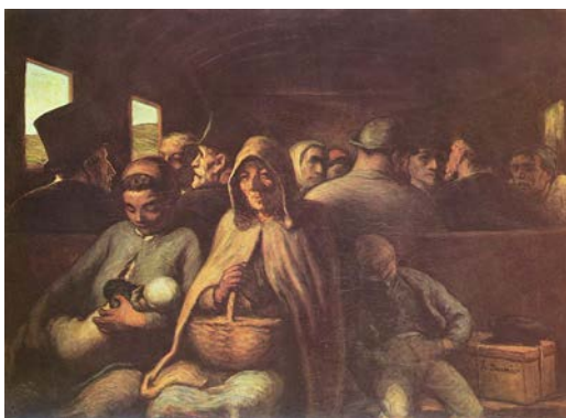
"Vagón de clase obrera" Honoré Daumier, 1862.

Para estar en casa utilizan la bata de té .