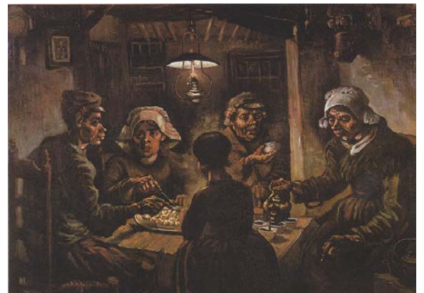
"Comedores de patatas" Van Gogh, 1885,

Indumentaria de la clase obrera: la mujeres llevan un tocado que cubre la cabeza, una capa corta, delantal, vestido, botas tipo borceguíes