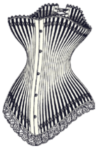
Corsé del año 1878.